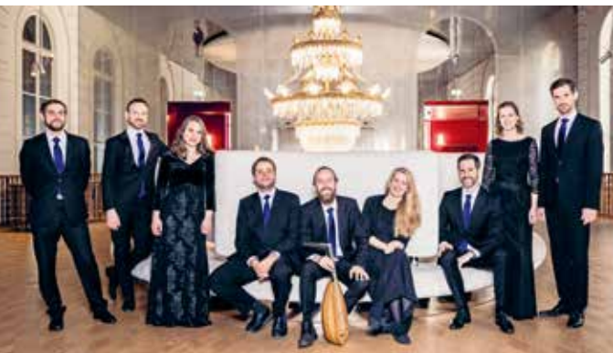
Voces Suaves

VEREIN ZUR FÖRDERUNG VON BASLER ABSOLVENTEN AUF DEM GEBIET DER ALTEN MUSIK Dornacherstrasse 161 A, 4053 Basel +41 61 361 03 54 - www.festtage-basel.ch