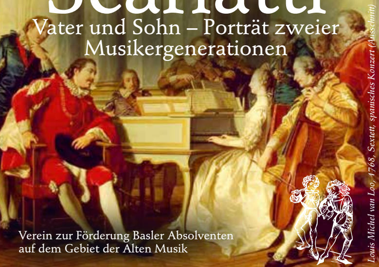
Louis Michel van Loo, 1768, Sextett, spanisches Konzert (Ausschnitt)

Vater und Sohn – Porträt zweier Musikergenerationen