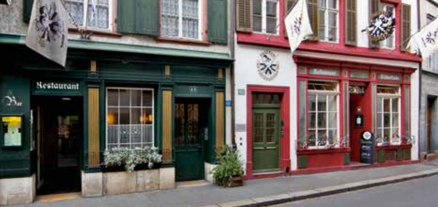
Restaurant Fischerstube & Restaurant Linde