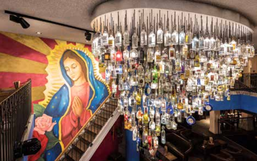
DESPERADO Basel – Mexican Restaurant, Bar & Lounge

DESPERADO Basel – Mexican Restaurant, Bar & Lounge.