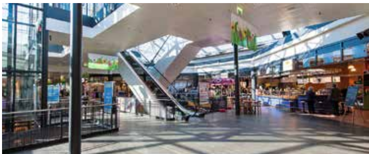
Grüssen-Center Pratteln , Grüssenweg 10, 4133 Pratteln, www.gruessen-center.ch , Mo–Fr 10.00–20.00, Sa 9.00–18.00