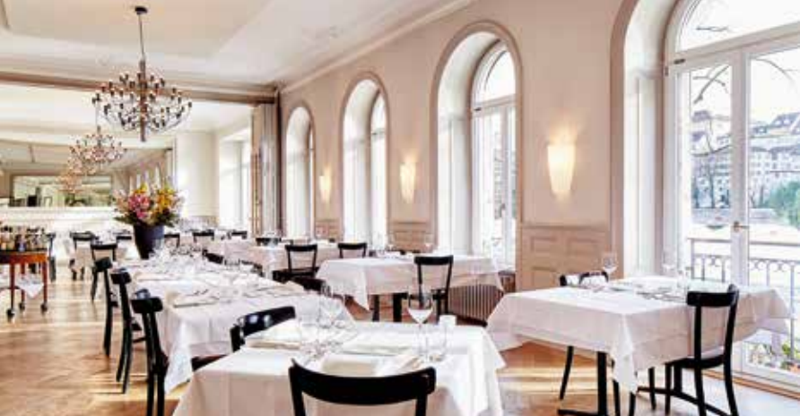
Restaurant Krafft Basel

Gasthof Zum Goldenen Sternen , St. Alban-Rheinweg 70, 4052 Basel 061 272 16 66, info@sternen-basel.ch , www.sternen-basel.ch Mo–Fr 11.00–14.00, 18.00–23.30, Sa 11.00–23.30, So 11.00–22.00. Historische Räume bis 100 Gäste. Sommerterrasse zum Rhein und im Hof. Täglich, aber nicht «alltäglich» verwöhnen wir Sie mit frischen und saisonalen Gerichten. Monatlich wechselndes Lucullus-Mahl in vier oder sieben Folgen.