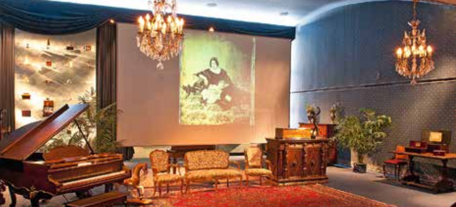
Museum für Musikautomaten