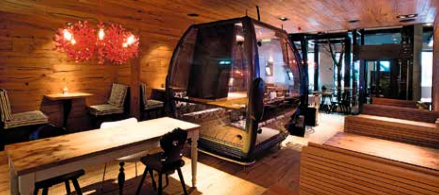
Kuuhl Elsas Alpchuchi

kuuhl , Elsas Alpchuchi, Steinenvorstadt 1a, 4051 Basel, Tel. +41 (0) 61 286 40 40, kuuhl.basel@gastrag.ch , www.kuuhl.ch , Öffnungszeiten: Mo–Do 11.00–22.00, Fr + Sa 11.00–23.00, So 10.00–22.00, sonntags Brunch 10.00–15.00