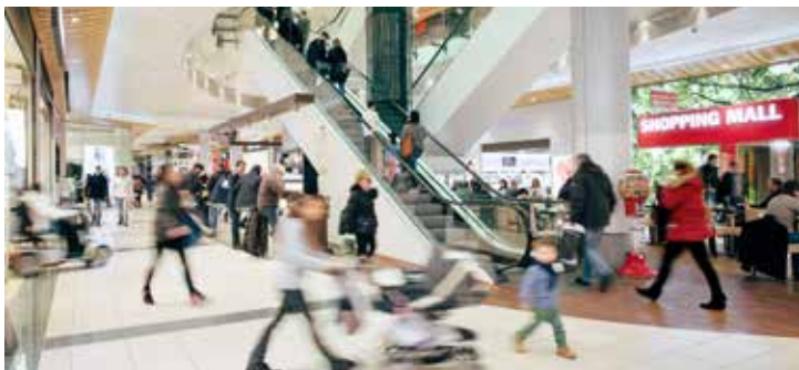
Shopping Center St. Jakob-Park , St. Jakobs-Strasse 397, 4052 Basel, www.sjp.ch . Bequem mit dem Tram 14 oder mit Bus 36, 37 und 47 erreichbar. Take tram no. 14 or bus no. 36/no. 37 or no. 47 to St. Jakob- Park station. Mo–Fr 9.00–20.00, Sa 9.00–18.00