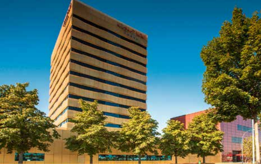
Airport Hotel Basel