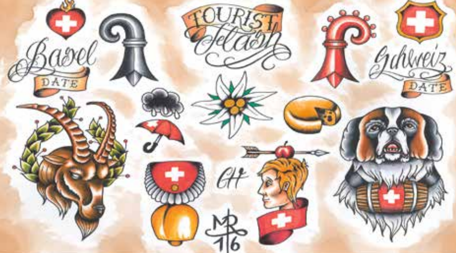
Basel Tattoo & Body Art Studio