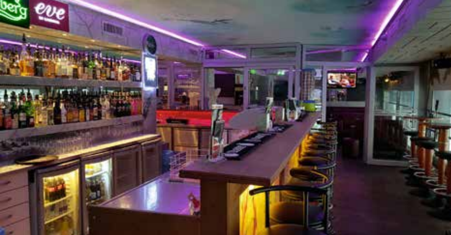
Café del Mar

Cafe del Mar , Steinentorstr. 30, 4051 Basel, 061 228 71 73, www.cafe-del-mar.ch , Cafe del Mar on Facebook. So-Do 14.00-03.00, Fr-Sa 14.00-05.00. Auf drei Stöcken bietet das Cafe del Mar ein einzigartiges, grosszügiges Angebot an Unterhaltung und Entspannung – Drinks, Cocktails, Shishas, Sommerterrasse, Raucherräume, DJ, Dart, Döggeli, Billard.