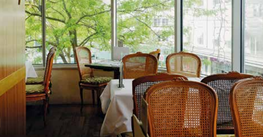
Grand Café Huguenin