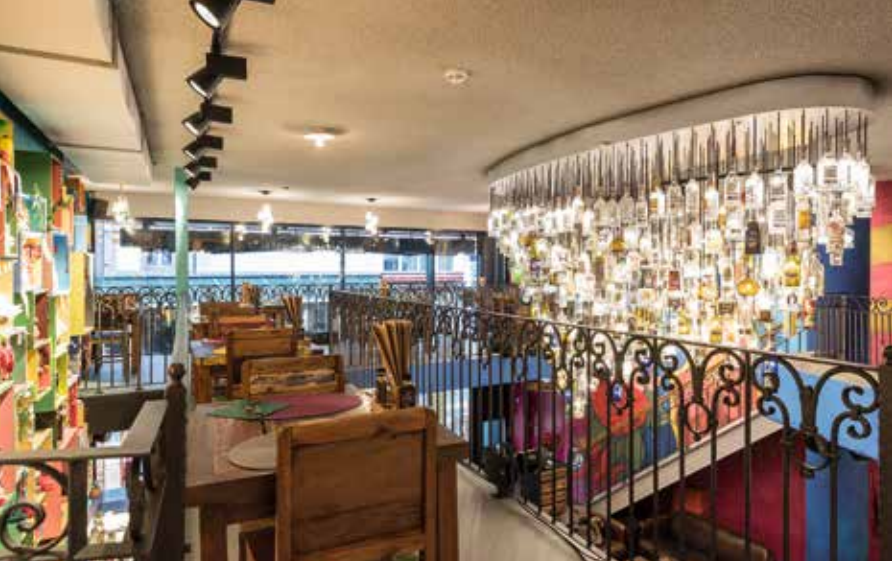
DESPERADO Basel – Mexican Restaurant, Bar & Lounge